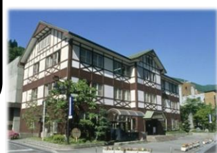
黒部川電気記念館 ・黒鉄宇奈月駅2階

黒部川の電源開発・宇奈月温泉・トロッコ電車の歴史を映像等で学ぶ (14:20~14:50)