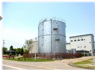
黒部浄化センター アクアパーク