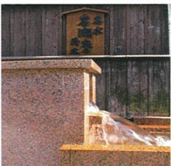
日本の名水「岩瀬家の清水」