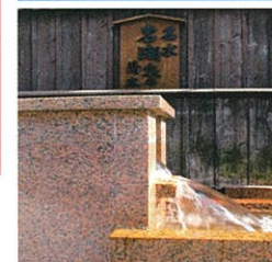
日本の名水「岩瀬家の清水」