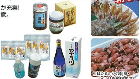
※ほたるいかに刺身・ホイルは季節限定です。