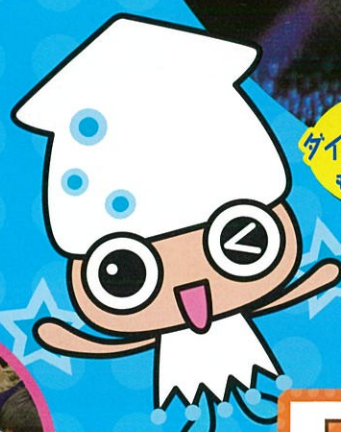
ナビカ ほたるいかミュージアム キャラクター