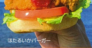
ほたるいかバーガー