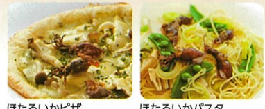
ほたるいかピザ ほたるいかパスタ