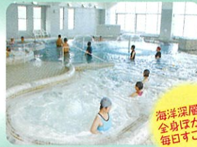
海洋深層水で全身ほかほか、毎日すこやか。

富山湾の深層水を利用したタラソテラピー（海洋療法）を体験する施設。海洋深層水のジャグジープールで歩行浴が人気。水着やスリミングキャップ、タオルのレンタルもあるので、気軽に楽しむことができます。