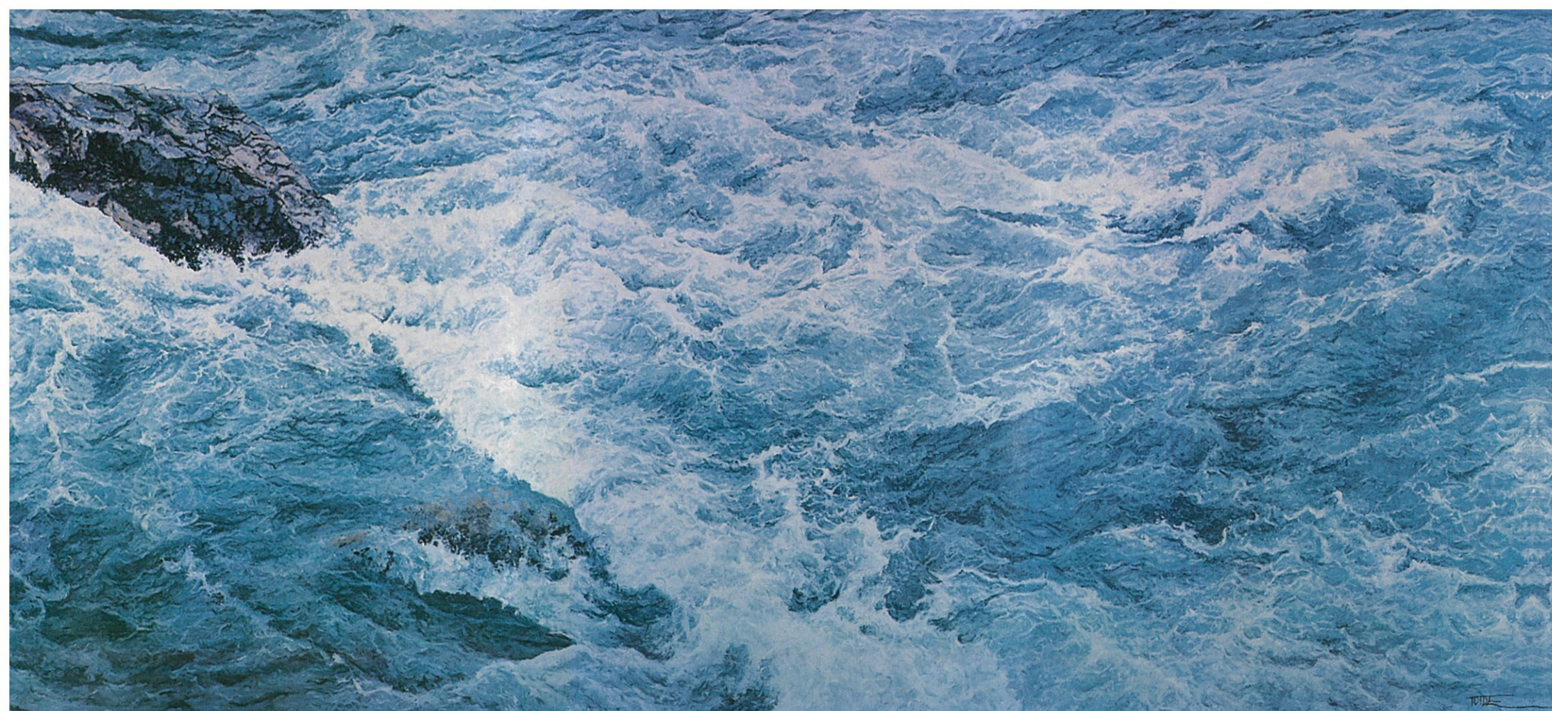
黒部川—日本アルプスを流れる川—1998年(右半分)