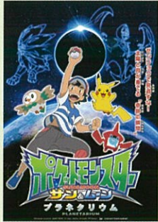
ポケットモンスター サン&ムーン プラネタリウム

©Nintendo・Creatures・GAME FREAK・TV Tokyo・ShoPro・JR Kikaku ©Pokémon