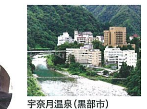
宇奈月温泉(黒部市)