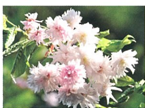
2 入善乙女キクザクラ(入善町) 1つの花に100枚以上の花びらをつける菊咲きの珍しい桜