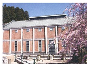
4 発電所美術館(入善町) 水力発電所を再生した美術館(国の登録有形文化財)