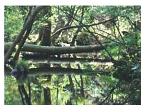
1 杉沢の沢スギ(入善町) 全国でも珍しい平地の湧水地に生育する自然林(国の天然記念物)