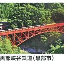
黒部峡谷鉄道(黒部市)