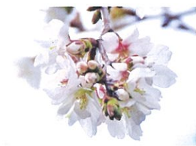
5 越の福かさね(入善町) 浄蓮寺と念興寺に樹生する新種で春と秋に咲く二季咲きの桜