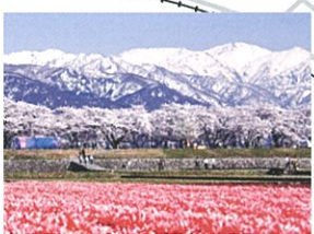
3 舟川ベリの桜とチューリップ(朝日町) 雪の北アルプスの山並みを背景に桜とチューリップが咲く名所