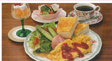
カフェモーツァルト 宇奈月 季節のモーツァルトランチ