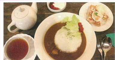
カフェ・セレネ 宇奈月 スパイス香るセレネのワッフル付ランチ